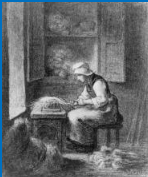
The carder - Millet, Jean-François (1814-1875)

Saint Louis Art Museum, Saint Louis, Missouri, US